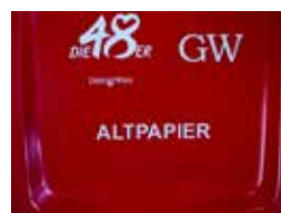
Heißprägung Hot printing