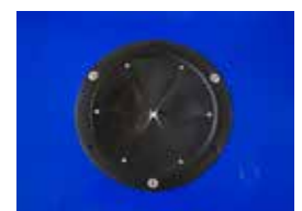
Glaseinwurföffnung (Standard Ø 160 mm, Sondermaß Ø 190 mm) Glass opening (standard Ø 160 mm, Special size Ø 190 mm)