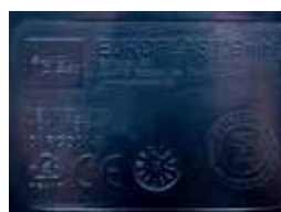
Reliefprägung Relief printing

Fußeintritt als Kipplerleichterung Foot inlet for easy tipping