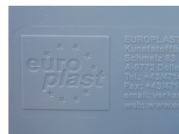
Reliefprägung Relief moulding