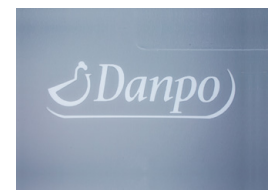
Heißprägung und Nummerierung Hot stamping and numbering